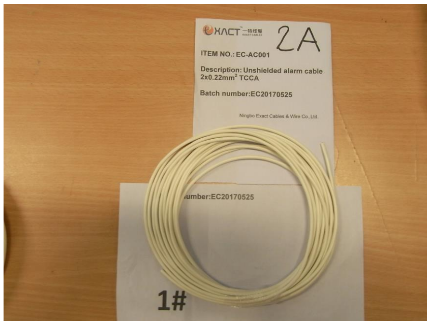
Cable/Cavo: UNSHIELDED ALARM CABLE 2x0,22 mm 2 TCCA Marcatura/Marking: Non presente / Not present