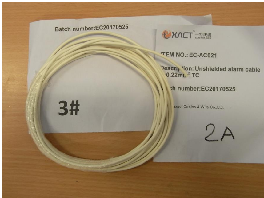
Cable/Cavo: UNSHIELDED ALARM CABLE 2x0,22 mm 2 TC Marcatura/Marking: Non presente / Not present